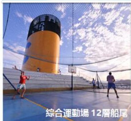
綜合運動場 12層船尾