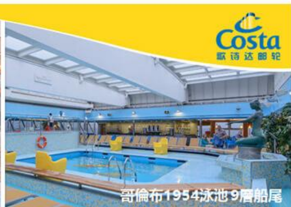
哥倫布1954泳池 9層船尾