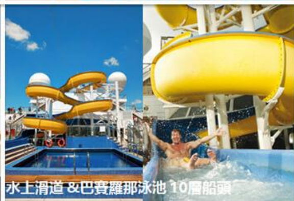
水上滑道 & 巴賽羅那泳池 10層船頭