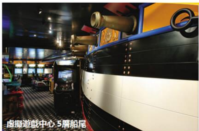
虛擬遊戲中心 5層船尾