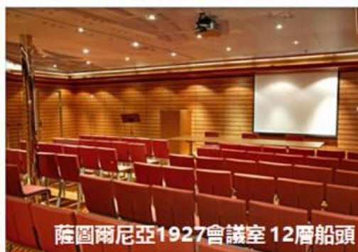
薩圖爾尼亞1927會議室 12層船頭