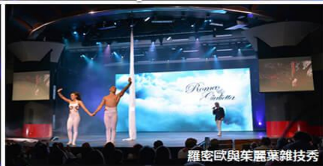
羅密歐與茱麗葉雜技秀