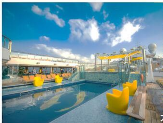
大洋洲1932泳池 9層船中