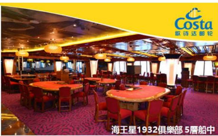
海王星1932俱樂部 5層船中