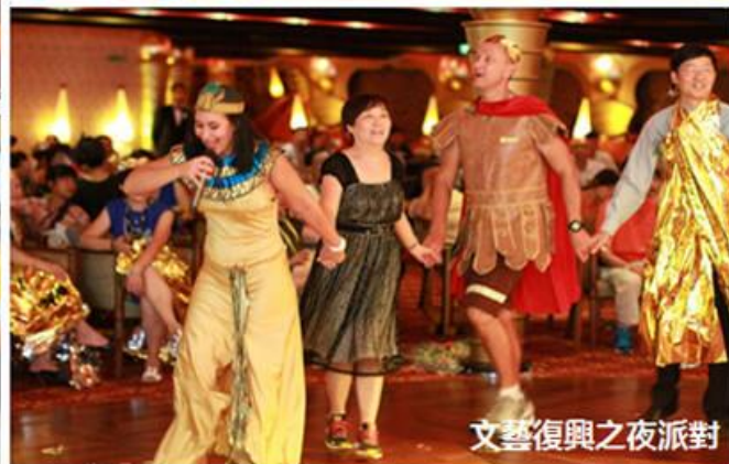
文藝復興之夜派對